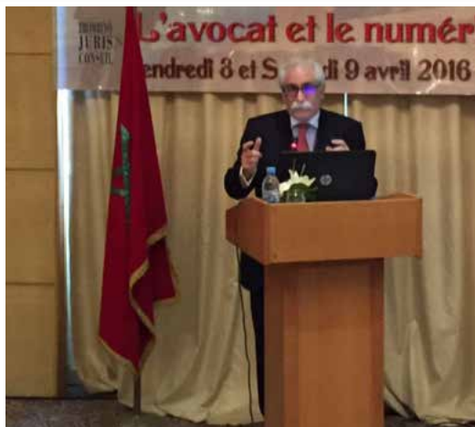
Predsjednik CCBE-a Michel Benichou drži govor u Casablanci