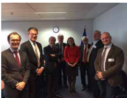
CCBE és az Európai Bizottság találkozója az EPPO kapcsán

2016. április 25-én a CCBE magas szintű találkozón vett részt az Európai Bizottság képviselőivel. A találkozót az Európai Ügyészi Hivatal felállításának javaslata kapcsán felmerülő aspektusok megvitatására hívták össze. A megfelelő eljárási biztosítékok, különösen a hatékony jogsegély rendszer szükségességét, mint alapvető követelményeket hangsúlyozták. Az ülésen kiemelték a megfelelő bírósági jogorvoslat szükségességét is.